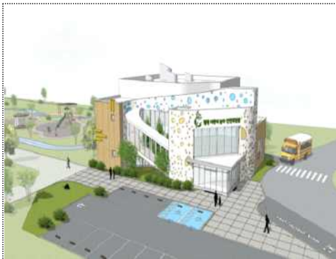
조감도(청평권역 어린이 놀이체험시설)