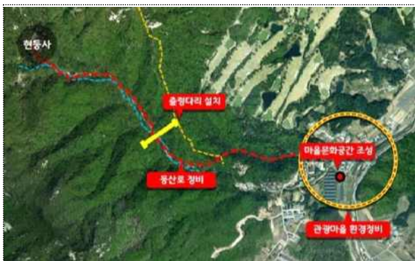
운악산 관광레저 단지 조성 위치도