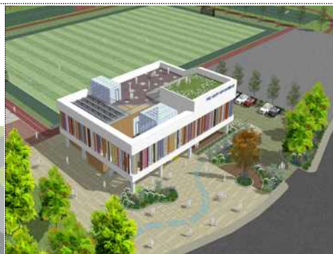
조감도(조종권역 어린이 놀이체험시설)