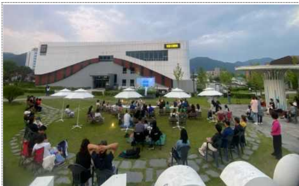
음악역1939 피크닉 콘서트