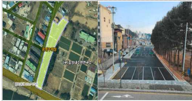
청평면 2구역(중앙내수면연구소 옆)