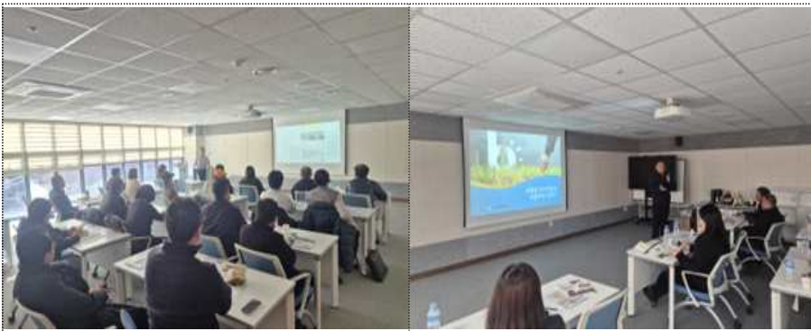
과실류 수출시장 이론 교육 및 2차 가공품 생산·수출 전략 교육