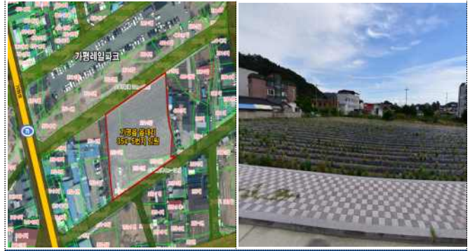
가평읍 레일바이크 인근