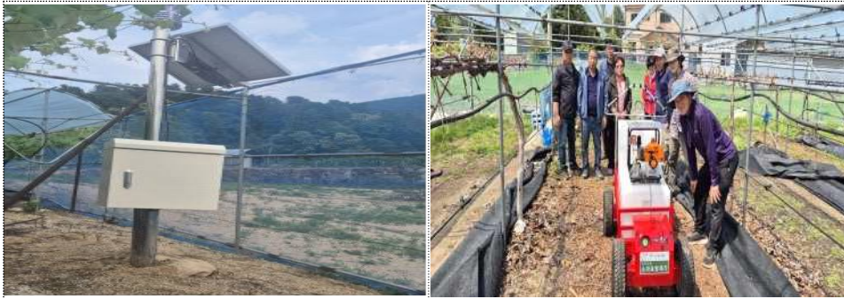
데이터 기반 생산모델 보급 시범