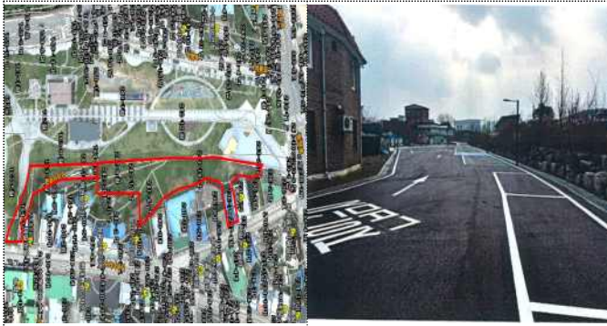
가평읍 어린이음악놀이터 옆