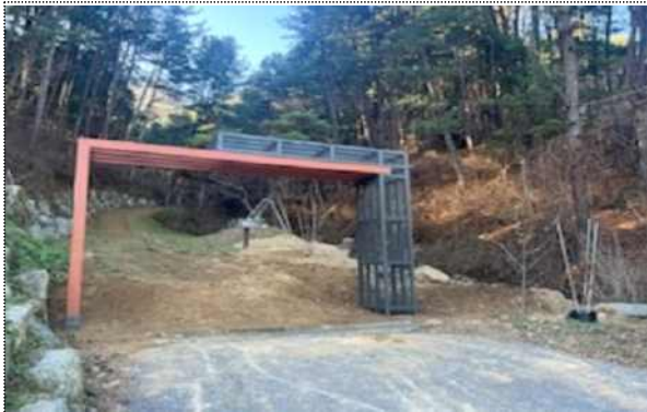
축령산 생태관광마을 둘레길 진입로