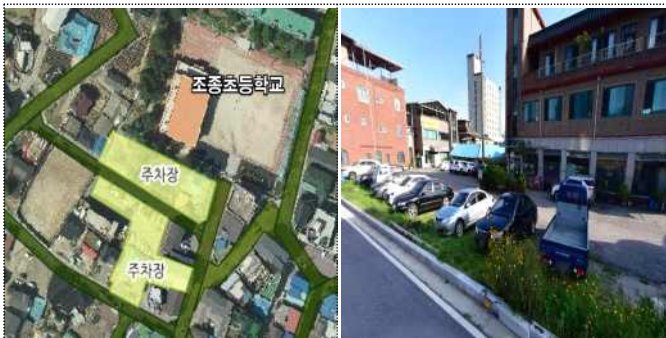
조종면 시가지(조종초교 앞)