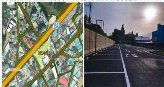
청평면 1구역(청평농협 뒤)